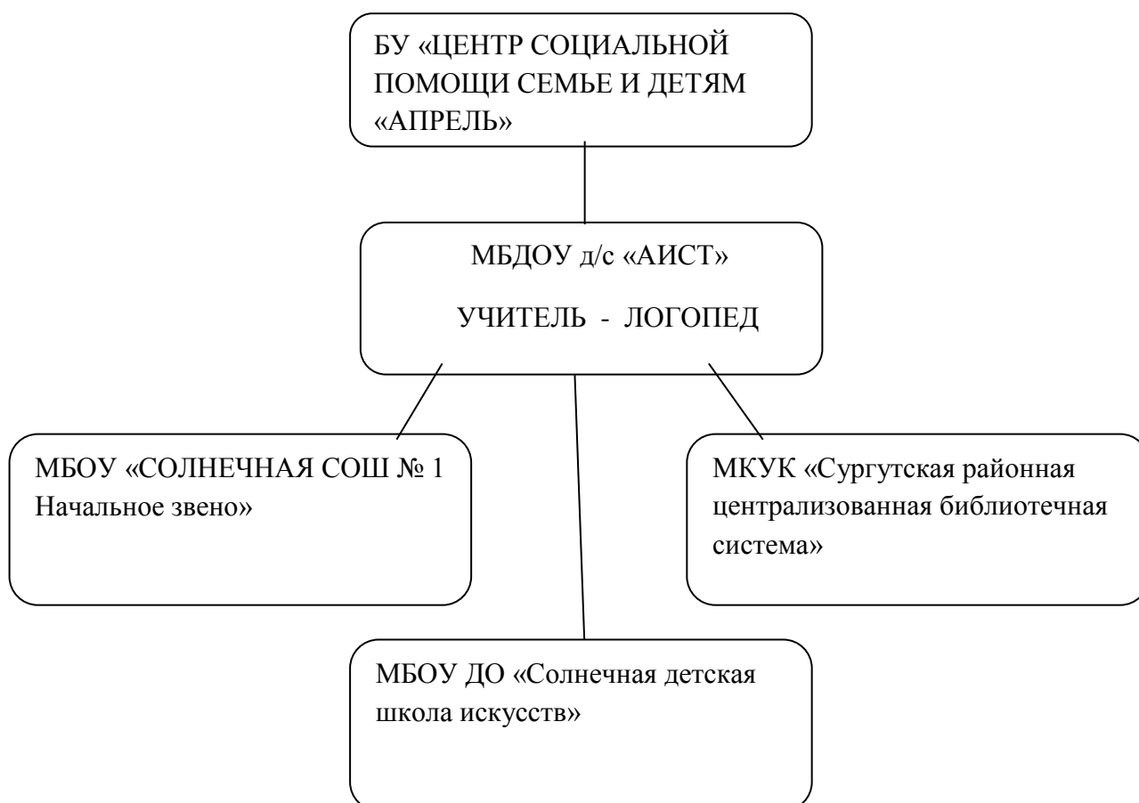
Модель взаимодействия учителя-логопеда с социальными партнерами