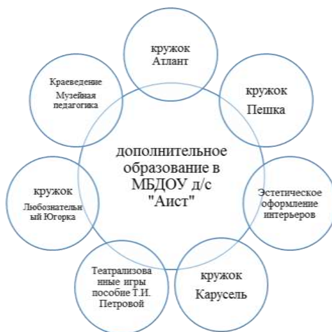
Модель реализации дополнительного образования в Организации