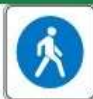
Знак "Пешеходная зона"