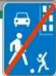
Знак "Конец жилой зоны"