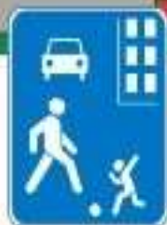
Знак "Жилая зона"

ПРАВИЛО 3: Не играй на проезжей части дороги даже во дворе собственного дома.